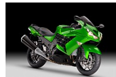
Golden Blazed Green (Grün)

Unverbindliche Preisempfehlung in Euro. Zuzüglich Fracht + Nebenkosten.