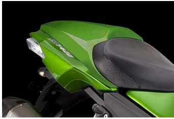
HÖCKERABDECKUNG € 236,80