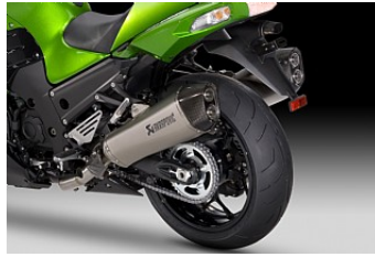
AKRAPOVIC-AUSPUFF* € 2.160,95