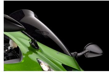
SPORT/TOUREN-SCHEIBE € 96,80