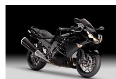
Metallic Spark Black (Schwarz)