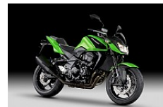
Candy Lime Green (Grün)

Unverbindliche Preisempfehlung in Euro. Zuzüglich Fracht + Nebenkosten.