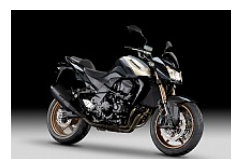
Metallic Spark Black (Schwarz)