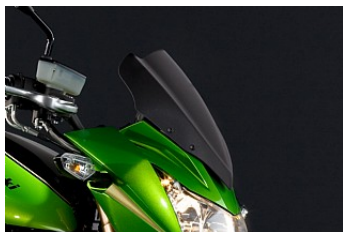
WINDSCHUTZSCHEIBE € 73,30