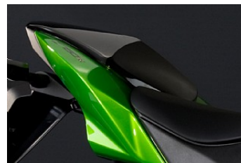
HÖCKERABDECKUNG € 172,95