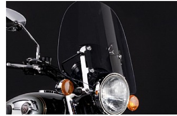
WINDSCHILD € 362,95