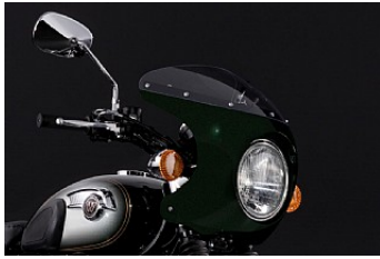
VERKLEIDUNG "BIKINI" € 495,05