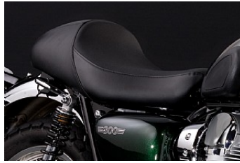
CUSTOM SITZBANK € 371,90