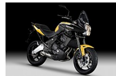
Pearl Solar Yellow/Ebony (Gelb/Schwarz)

Unverbindliche Preisempfehlung in Euro. Zuzüglich Fracht + Nebenkosten.