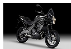
Metallic Spark Black (Schwarz)