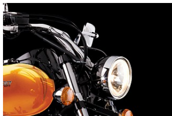
Custom-Scheinwerfer, High-Rise Bars