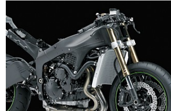
Überarbeitete Fahrwerksbalance und Massenzentralisierung