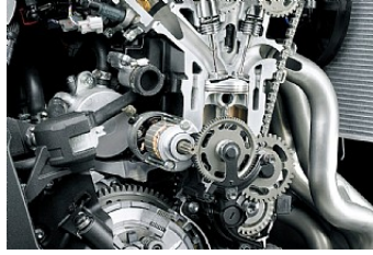
Höhere Leistung im mittleren Drehzahlbereich