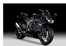
Metallic Spark Black / Flat Ebony