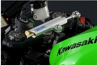
Lenkungsdämpfer in Rennqualität