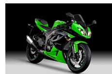
Lime Green / Metallic Spark Black (Grün/Schwarz)

Unverbindliche Preisempfehlung in Euro. Zuzüglich Fracht + Nebenkosten.