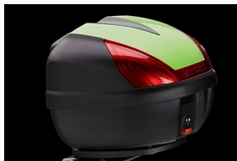
TOPCASE 30L € 59,20