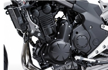
Kompakter, drehfreudiger Motor