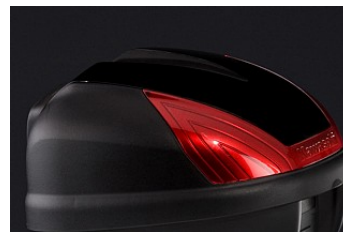
TOPCASE-ABDECKUNG (30L) € 58,65