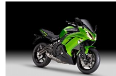
Candy Lime Green (Grün)

Unverbindliche Preisempfehlung in Euro. Zuzüglich Fracht + Nebenkosten.