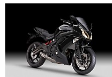
Metallic Spark Black (Schwarz)